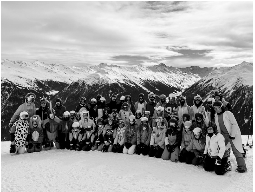
SchmuDo im Skilager

Car wurde es dann ziemlich schnell ruhig und nicht wenige träumten wohl von schnellen Kurven und hohen Sprüngen der zurückliegenden Woche.